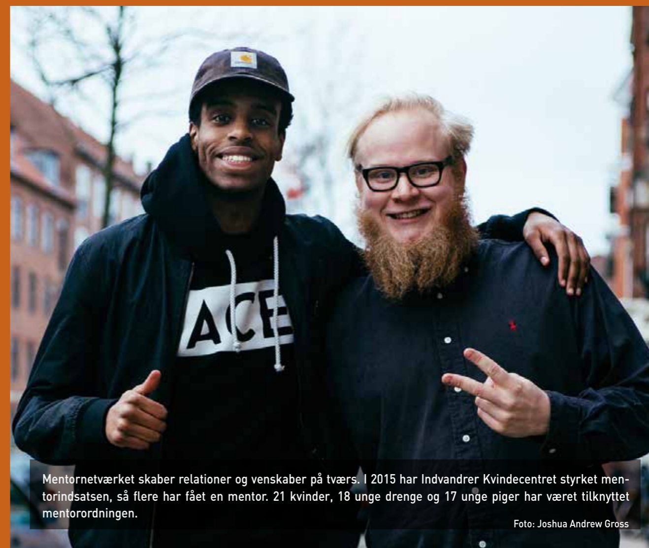
Mentornetværket skaber relationer og venskaber på tværs. I 2015 har Indvandrer Kvindecentrum styrket mentorindsatsen, så flere har fået en mentor. 21 kvinder, 18 unge drenge og 17 unge piger har været tilknyttet mentorordningen.

"Man mærker tydeligt, at der bliver værnet om brugerne. Man kan også sige, at Indvandrer Kvindecentrum er interkulturel, mens verden ude på den anden side af døren er multikulturel. Her skal ingen integreres ind i en anden kultur, for her danner vi kulturen sammen. Vi mødes ikke som enten bruger eller hjælper. Vi mødes som mennesker."