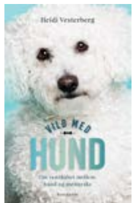
”Vild med hund” af Heidi Vesterberg, Forlaget Rosinante, 208 sider, 150 kr.

Det er altid dejligt at blive inviteret på en spontan date eller drink på vej hjem fra arbejde. Som hundeejer er du nødt til at sige nej tak. Du skal nemlig hjem til hunden, gå tur i regnvejrs og samle bæ op. I kan heller ikke rejse på ferie uden at tage hunden med eller tvivle på, om du kan lade hunden være alene nogle stakler til at passe dyret, og så har du alligevel dårlig samvittighed hele ferien. Og selv om festen har udviklet sig til en rigtig dansefest, er du nødt til at tage hjem. Nogen skal tage sig af hunden, og det er som regel dig. Også selv om børnene engang påstod noget andet.